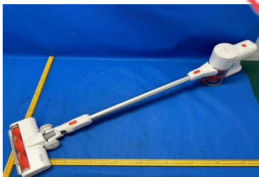
Imagen en color del producto: