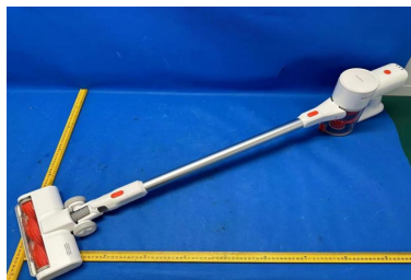
Imagem a cores do produto: